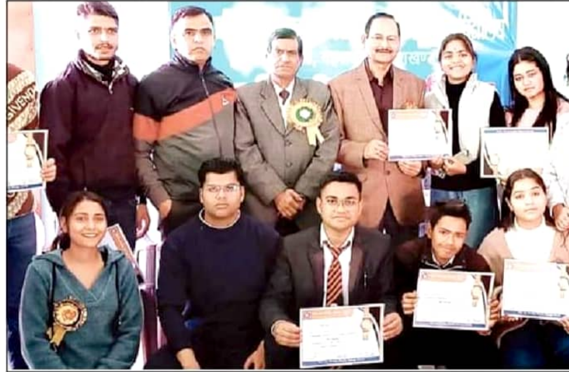
प्रतियोगिता के विजेता प्रमाण पत्र के साथ।

प्रो. एनएसएस का मुख्य उद्देश्य 'सेवा के माध्यम से शिक्षा' है। कहा कि छात्र जीवन से व्यक्तित्व का विकास प्रारंभ हो जाता है,