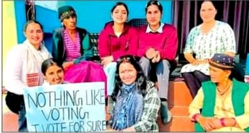
मतदान के प्रति जागरूक करते छात्र-छात्राएं।