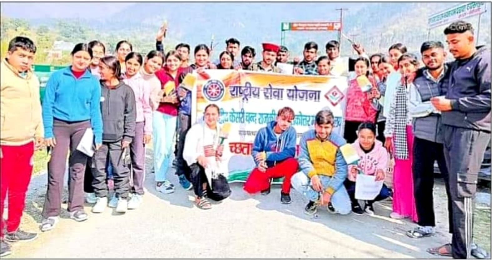
शिविर के दूसरे दिन लेखन कार्य के दौरान एनएसएस के छात्र।