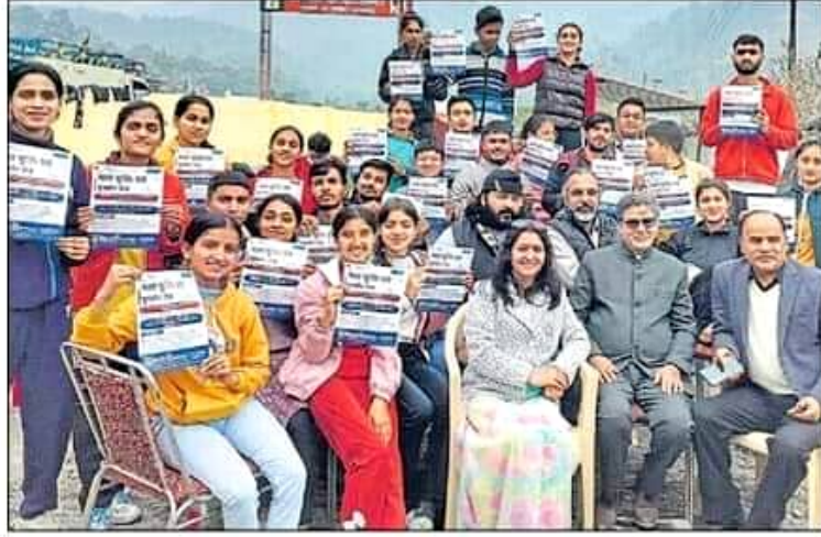
डाकपत्थर पीजी कॉलेज के स्वयंसेवकों को सोमवार को राष्ट्रीय सेवा योजना के विशेष शिविर के तहत नशा मुक्ति को लेकर जागरूक किया गया। • हिन्दुस्तान