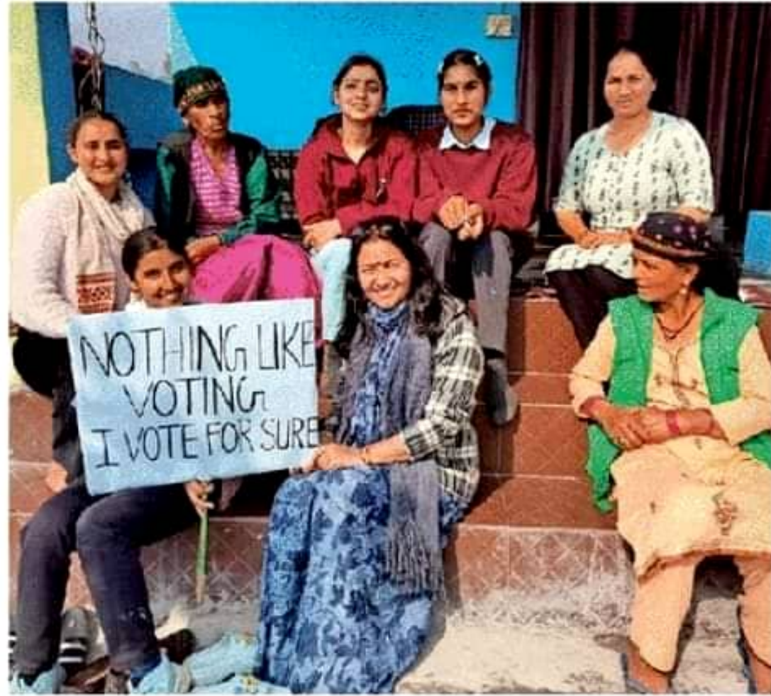
डाकपत्थर महाविद्यालय की राष्ट्रीय सेवा योजना इकाई के शिविर में मतदाताओं को जागरूक करते स्वयंसेवी • सामाजिक कार्यकर्ता अधिकारी

राष्ट्रीय सेवा योजना इकाई के स्वयंसेवियों ने व्यासनहरी में ग्रामीणों को किया जागरूक