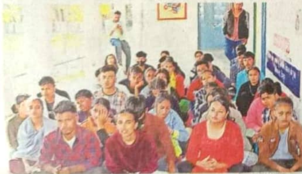
राजकीय पूर्व माध्यमिक विद्यालय छोटूवाला विकासनगर में डाकपत्थर महाविद्यालय के एनएसएस शिविर में मौजूद स्वयंसेवी

जागरण संवाददाता, विकासनगर: वीर शहीद केशरी चंद राजकीय स्नातकोत्तर महाविद्यालय डाकपत्थर की एनएसएस इकाई के सात दिवसीय विशेष शिविर के दूसरे दिन गुरुवार को नशे से शरीर पर पड़ने वाले दुष्प्रभाव की जानकारी दी गई।