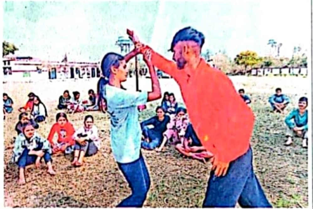
छोटूवाला स्कूल में डाकपत्थर महाविद्यालय के एनएसएस शिविर में कराटे के गुर सीखते स्वयंसेवी ● सागर महाविद्यालय

● कार्यक्रम अधिकारी ने छात्रों को दी करियर से संबंधित जानकारी