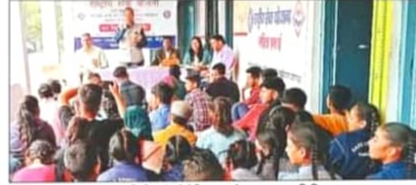
एनएसएस शिविर में संबोधित करते हुए मुख्य अतिथि। संवाद

राजकीय उच्चतर माध्यमिक विद्यालय में चल रहे शिविर में