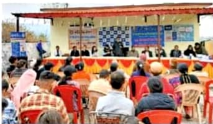
डा.कमलेश्वर महाविद्यालय के एनएसएस शिविर में स्वयंसेवियों को जागरूक करते मनोचिकित्सक • सलाहकार, कार्यकाल अधिकारी